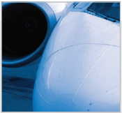
航空航天与电子产品